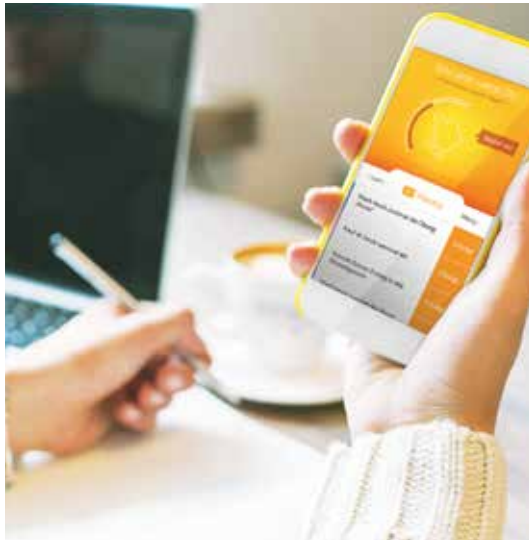
Immer und überall dabei: Die moove App

Die vitaliberty GmbH setzt an genau dieser Verbindung von bewährten BGF-Maßnahmen und digitalen Gesundheitsprogrammen und an und schafft es so, organisationale und individuelle Gesundheitslösungen miteinander zu vereinen und jedem Unternehmen genau das Gesundheitsmanagement zu bieten, das zu seinen Mitarbeitern und seinen Anforderungen passt.